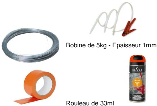
Bobine de 5kg - Epaisseur 1mm